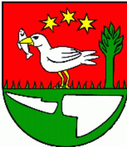
Vyobrazenie erbu obce Vyšná Myšľa